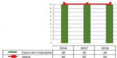
Gráfica con la evolución de los valores y metas del indicador a nivel propósito